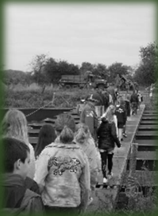
Over de pontonbrug

Omdat het 75 jaar Market Garden is zijn wij met groep 5/6/7/8 , Juf Diny, juf Silvia, stagiaires en rij ouders naar Kampement Grave geweest. Dit was op een woensdag ochtend 18 september. Een militair vertelde ons een klein verhaal, we werden in 2 groepen verdeeld, groep 5/6 ging met iemand mee, en groep 7/8 ging een andere weg. We liepen over de pontonbrug daar vertelde een militair een kort verhaal, groep 7/8 werd in verschillende kleine groepjes verdeeld zodat we allemaal mooie verhalen konden gaan luisteren en dingen konden zien.