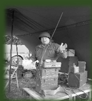
Militair met geluidsmateriaal

Als eerste kwamen we bij een tent, daar vertelde een militair over hoe ze communiceerde met elkaar, over de telefoon en de radio. Daarna gingen we naar het hospitaal daar werd onder andere uit gelegd hoe ze de materialen schoon maakte en hoe ze verdoofde. In een andere tent werd uit gelegd welke wapens er waren en hoe ze schoon werden gemaakt en waarom. Als laatste zijn we naar 2 bunkers geweest, zo kon je ervaren hoe klein het is van binnen.