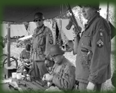
Uitleg over wapens

Als eerste kwamen we bij een tent, daar vertelde een militair over hoe ze communiceerde met elkaar, over de telefoon en de radio. Daarna gingen we naar het hospitaal daar werd onder andere uit gelegd hoe ze de materialen schoon maakte en hoe ze verdoofde. In een andere tent werd uit gelegd welke wapens er waren en hoe ze schoon werden gemaakt en waarom. Als laatste zijn we naar 2 bunkers geweest, zo kon je ervaren hoe klein het is van binnen.