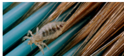
Hoofdluis op een kam.